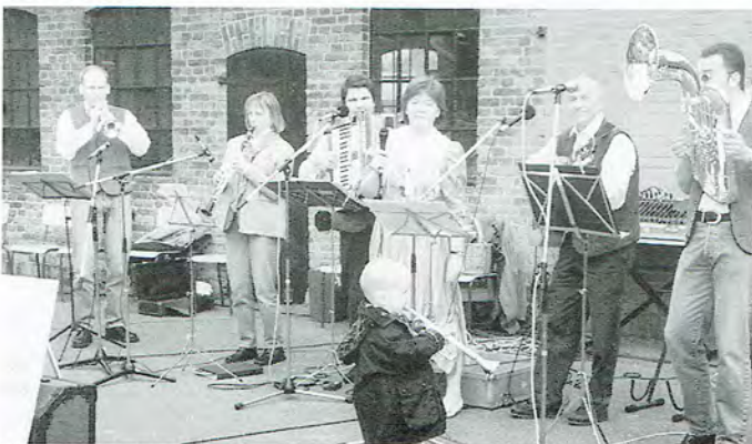
Sie unterhielten die Gäste: Die „Original Obereiderkainer“

Unter musikalischer Begleitung der Gruppe „Original Obereiderkainer“ feierten die Rickerter und viele auswärtige Gäste unter dem in diesem Jahr mit zwei Kränzen geschmückten Maibaum.